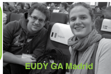
EUDY GA Madrid