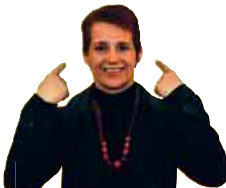
Koningin Fabiola . Hoe kan je de vorstin beter typeren dan aan de hand van haar kapsel, aangeduid met een krulbeweging.