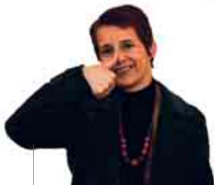
Johan Vande Lanotte (SP.A). Wie gisteren naar 'De slimste mens' keek, kon het zien: er is iets vreemds aan zijn neus.