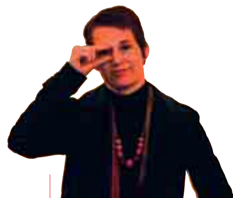
...en dit is Lambert tegenwoordig, ettelijke kilo's lichter en voortaan dus veeleer uitgebeeld aan de hand van zijn brilletje.