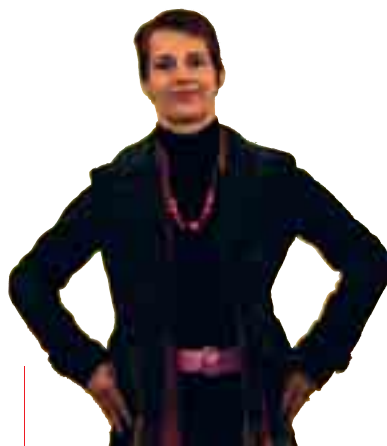
Frank Vandenbroucke (SP.A). Een naamgebaar op basis van zijn familienaam: wie hem uitbeeldt, trekt een imaginaire broek aan.