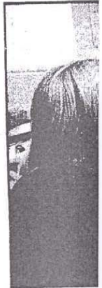
Praten met Filip is ook

jaar naar de avond gaan, om gespectaculair te volgen." Sinds september 1 baan bij Studio 100 in een bij uitstek c bedrijf meedraait op rolletjes? "Het zo'n groot bedrijf toe." Studio 100 is en bekend bedrijf. Dat schrikte me ir valt allemaal mee. hebben nooit een werkt, maar ieder Als Filip me even zien, maak ik ken. "Toen we te hore we collega doofs we wel een beetje en Samson en Gt Graeve. "Het is z waar je aan te v had ik ook een b