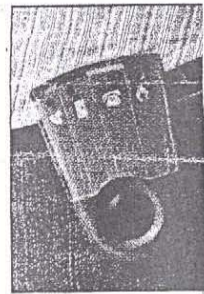
Twee snuffels uit het huishouden van Filip en Katrien: de deurbel is verbonden met een flitslicht, en een biepertje doet dienst als babyfoon.