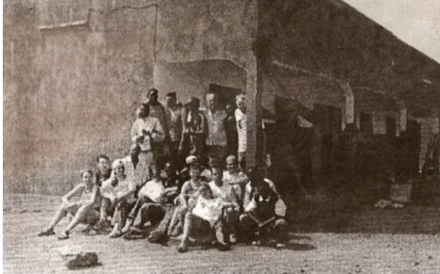
Familiefoto van Burkinese en Belgische doven in school Benaja/CEFISE van Ouagadougou.